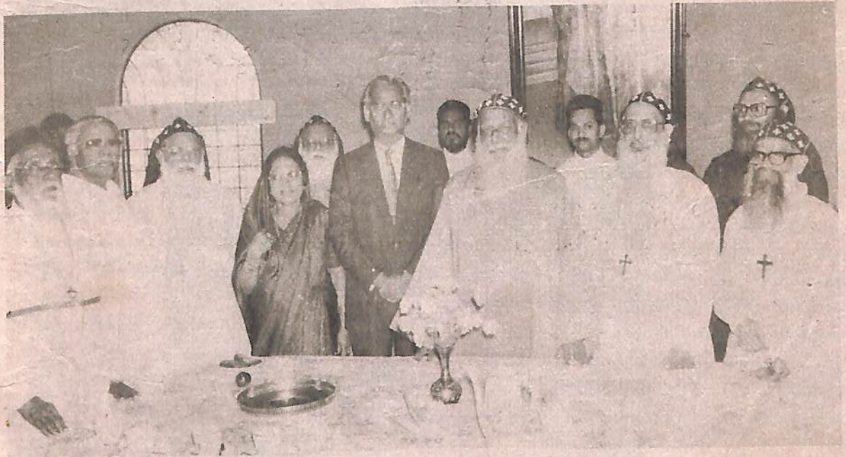
മദ്രാസ് ഗവണ്ണർ ഡോ. പി.സി. അലക്സാണ്ടറും ഭാര്യയും പ. കാതോലിക്കാബാവായുമൊന്നിച്ചു ദേവലോകം അരമനയിൽ.